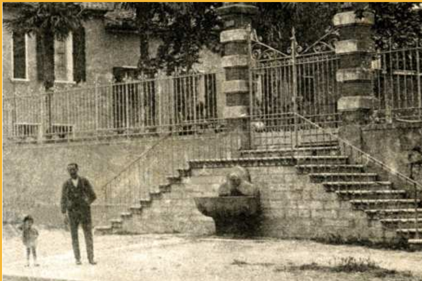
La fontaine placée entre les escaliers après transformation du jardin du couvent en square public